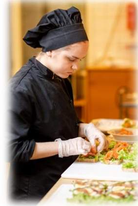
Kuva 6. Ravintola- ja cateringalan pt. opiskelija.