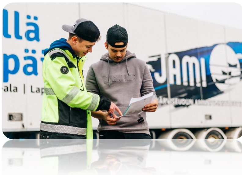
Kuva 4. Logistiikan pt. opiskelijoita.

Talousarviossa annetaan valtuutus jatkaa tilinpäätöksessä 2025 todettavia keskeneräisiä hankkeita vuoden 2025 talousarvion puitteissa, vaikka hankkeeseen ei vuoden 2026 talousarviossa olisi määrärahaa.