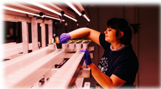
Kuva 9. Turvevapaa ruokaketju- hanke, vertikaaliviljelmä.