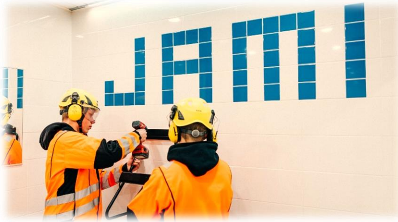
Kuva 10. Rakennusalan pt. opiskelijoita.

Investointien tulorahoitusprosentti mitta sitä, kuinka suuri osa investoinneista kyetään rahoittamaan tulorahoituksella. Kun luku on < 100, Loppuosa investoinneista katetaan joko omalla tai vieraalla pääomalla.