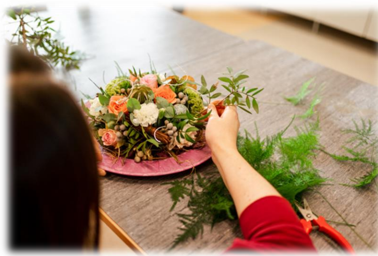
Kuva 8. Puutarha-alan ammattitutkinto, floristiikan osaamisala.