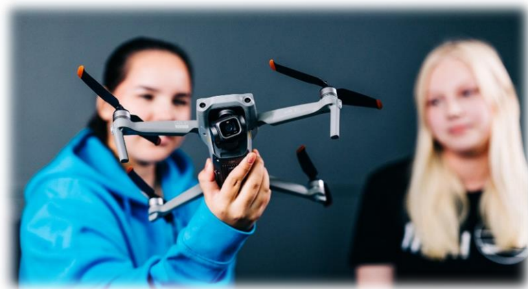
Kuva 11. Liiketoiminnan pt. opiskelijoita.