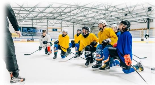
Kuva 5. Urheilulinjan opiskelijoita.

Suunnitelmakaudelle kohdistuvia muita tavoitteita ovat matkailualan asiakaspalvelualan koulutuksen edelleen kehittäminen yhteistyössä alueen matkailuyritysten ja -yhdistysten kanssa, osatutkintokoulutustarjonnan lisääminen ja toisen asteen yhteistyön vahvistaminen Järvisseudun lukioiden kanssa urheilulinjan ja muun yhteistyön ja kansainvälisen toiminnan lisääminen mm. opiskelijavaihdon ja hankkeiden kautta.