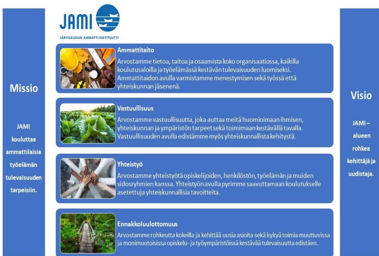
Kuva 2. Strategiakaavio 2023

Kuntayhtymän strategia päivitetään seuraavan kerran vuonna 2026 vastaamaan uusia vaatimuksia.